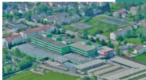
Heinrich-Schickhardt- Schule Freudenstadt